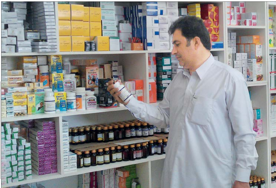
به‌کار رانیتیدین داروهای جایگزین استفاده کنید

دکتر سبزواری درباره راه حل این مشکل در شرایط فعلی معتقد است از آنجای که رانیتیدین را شرکت‌های داروسازی مختلفی تولید می‌کنند، گام اول این است که محصولات شرکت‌ها بررسی شده و فهرستی از محصولات آنها تهیه شود که کدام یک از این محصولات مجاز هستند و کدام غیرمجاز. رئیس انجمن متخصصان علوم دارویی تأکید کرد: برای مصرف ماده نیتروسودی‌متیل‌آمین، یک حد مجاز روزانه معادل ۹۶ نانوگرم در روز برای مصرف این ماده تعیین شده است که افراد با مصرف این میزان دچار مشکل نمی‌شوند. این ماده همچنین